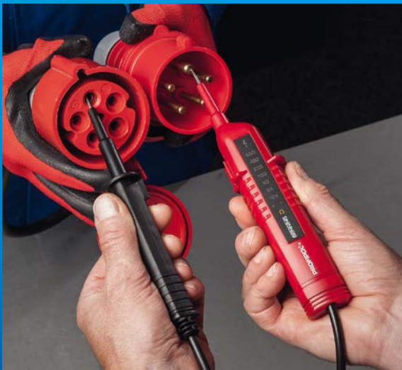
Durchgangsprüfung an Leitungen