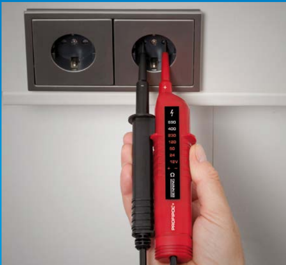
Einhandbedienung an Steckdosen