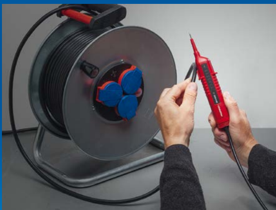
Lokalisierung von Kabelbrüchen